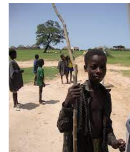
Tierra Solidaria CLM