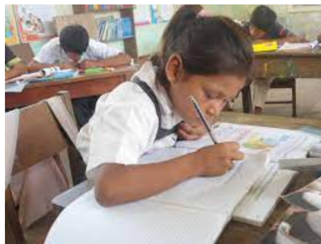
Tierra Solidaria CLM_Aramango (Perú)