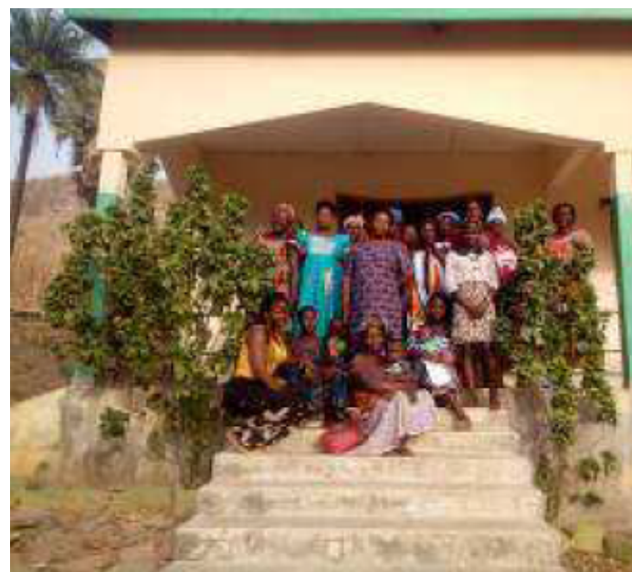
APC_ Asociación de Acción por el Cambio Defalé (África)